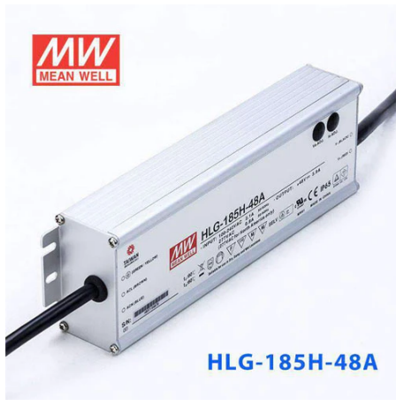
RF29209 HLG – 185H – 48AHLG