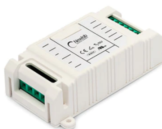
RF26994 Dimmer Led