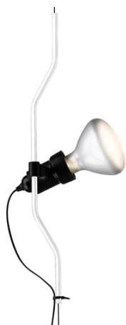
F5700009 Parentesi dimmer élément de complément - Blanc

par Achille Castiglioni & Pio Manzù , 1971