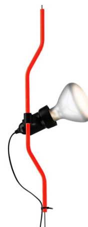
F5700035 Parentesi dimmer élément de complément - Rouge