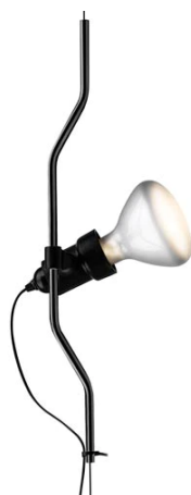
F5500030 Parentesi elemento complemento - Nero