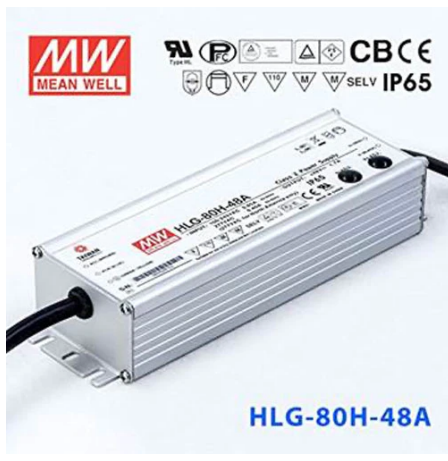
RF29208 HLG – 80H – 48A