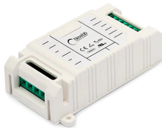
RF26994 Dimmer Led