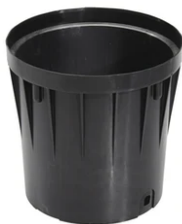
Box for installation F4599000