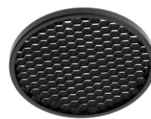
Honeycomb 6 units Kit F4557000