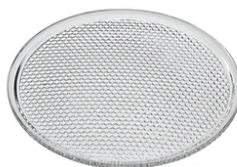
Flood lens 6 units Kit F4560000