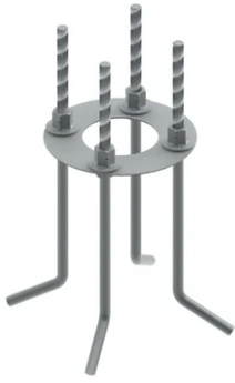
Base plate with bolt F023Z060000