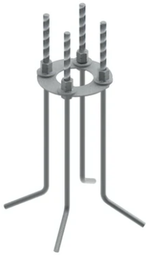
Base plate with bolt F023Z050000