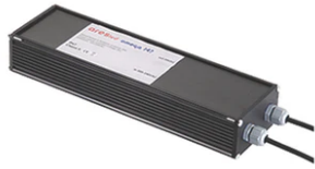
Power supply 24Vdc 50W / 120-240V IP67 Class II selv. Non Dimmable RF25755