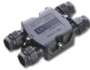
4 way junction box 5 poles IP68 (6-14 mm cables) F990C030000