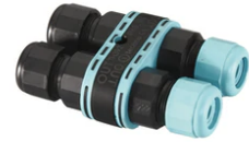
3/4 way terminal block 4 poles IP68 H2O stop. (ø5,5+12mm cable) F990C010000