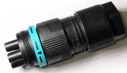
Plug&play connector 5 poles F021Z040000