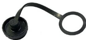
Cap for panel (on the fixtures) plug connector 4-5 poles F021Z070000