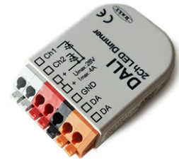
DALI PWM control interface 24Vdc 90W IP20. Power supply not included F990B09A000