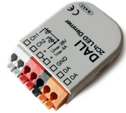
DALI PWM control interface 24Vdc 90W IP20. Power supply not included F990B09A000