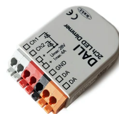
DALI PWM control interface 24Vdc 90W IP20. Power supply not included F990B09A000