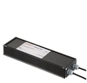
Power supply 24Vdc 100W / 120-240V IP67 Class II selv. Non Dimmable RF25756