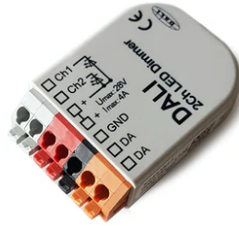
DALI PWM control interface 24Vdc 90W IP20. Power supply not included F990B09A000