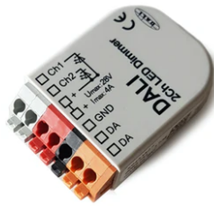
DALI PWM control interface 24Vdc 90W IP20. Power supply not included F990B09A000