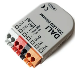
DALI PWM control interface 24Vdc 90W IP20. Power supply not included F990B09A000