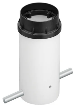
Box for ground installation F001Z020000