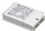
Power supply 24Vdc 17W / 110-240V (15W@110V) IP20 Class II selv. Dimmable 1-10V RF25750