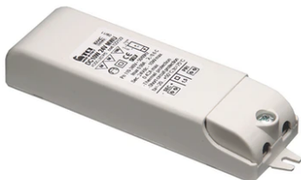
Power supply 24V 10W /110-240V IP20 Class II selv. Non Dimmable RF25747