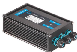
Power supply 24Vdc 20W / 110-240Vdc (15W@110V) IP67 Class II selv. Dimmable DALI RF26387