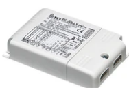
Power supply 24Vdc 17W / 110-240V (15W@110V) IP20 Class II selv. Dimmable 1-10V RF25750