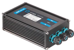
Power supply 24Vdc 20W / 110-240Vdc (15W@110V) IP67 Class II selv. Dimmable DALI RF26387