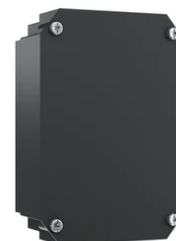
Box for installation for masonry or concrete wall F5962000