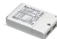
Power supply 24Vdc 17W / 110-240V (15W@110V) IP20 Class II selv. Dimmable 1-10V RF25750