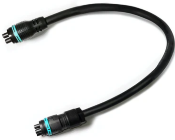
Double 4-pole plug&play connector + 3-pole cable, 600 mm length. F021Z020000