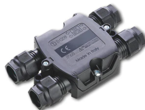
4 way junction box 5 poles IP68 (6-14 mm cables) F990C030000