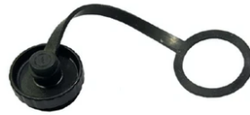
Cap for panel (on the fixtures) plug connector 4-5 poles F021Z070000