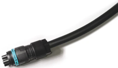
4-pole plug&play connector + 3-pole cable, 5000 mm length. F021Z030000