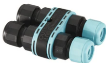
3/4 way terminal block 4 poles IP68 H2O stop. (ø5,5÷12mm cable) F990C010000