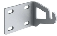
One pair of short brackets L 80 mm. Deep Brown F1203018