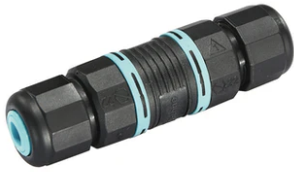
2 way terminal block 4 poles IP68 H20 stop. (ø5,5÷12mm cable) F990C00A000