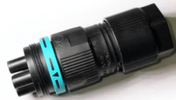
Plug&play connector 4 poles F021Z010000