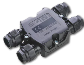
4 way junction box 5 poles IP68 (6-14 mm cables) F990C030000