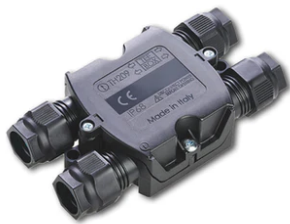
4 way junction box 5 poles IP68 (6-14 mm cables) F990C030000