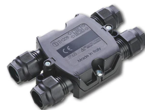
4 way junction box 5 poles IP68 (6-14 mm cables) F990C030000