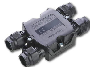
4 way junction box 5 poles IP68 (6-14 mm cables) F990C030000