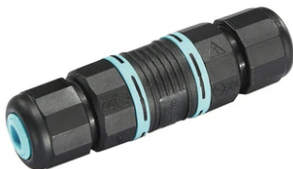
2 way terminal block 4 poles IP68 H2O stop. (ø5,5÷12mm cable) F990C00A000