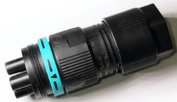
Plug&play connector 4 poles F021Z010000