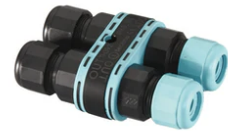
3/4 way terminal block 4 poles IP68 H2O stop. (ø5,5÷12mm cable) F990C010000