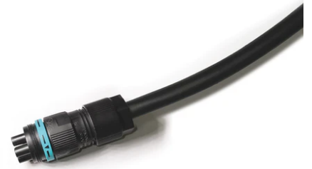
4-pole plug&play connector + 3-pole cable, 5000 mm length. F021Z030000