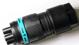
Plug&play connector 5 poles F021Z040000