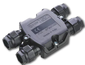
4 way junction box 5 poles IP68 (6-14 mm cables) F990C030000