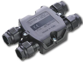
4 way junction box 5 poles IP68 (6-14 mm cables) F990C030000