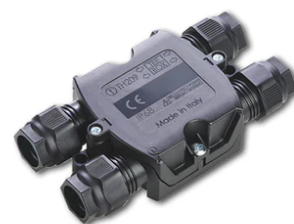
4 way junction box 5 poles IP68 (6-14 mm cables) F990C030000