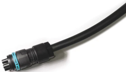
4-pole plug&play connector + 3-pole cable, 5000 mm length. F021Z030000