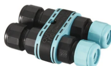
3/4 way terminal block 4 poles IP68 H2O stop. (ø5,5+12mm cable) F990C010000