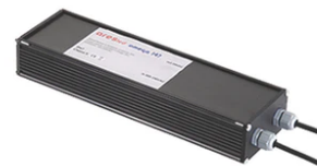
Power supply 24Vdc 50W / 120-240V IP67 Class II selv. Non Dimmable RF25755