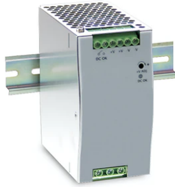
Power supply 48V 240W /110-240V single output DIN RAIL. RF25746