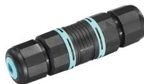
2 way terminal block 4 poles IP68 H2O stop. ( \varnothing 5,5 \div 12 mm cable) F990C00A000