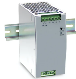
Power supply 48V 240W / 110-240V single output DIN RAIL. RF25746