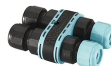
3/4 way terminal block 4 poles IP68 H2O stop. ( \varnothing 5,5 \div 12 mm cable) F990C010000