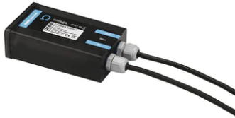
Power supply 48V 60W / 110-240V IP67 Class II selv eq. RF25753