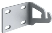
One pair of short brackets L 80 mm. Deep Brown F1203018