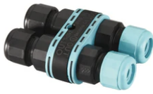
3/4 way terminal block 4 poles IP68 H2O stop. (ø5,5÷12mm cable) F990C010000