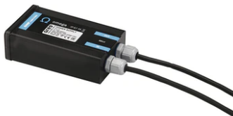
Power supply 48V 60W / 110-240V IP67 Class II selv eq. RF25753