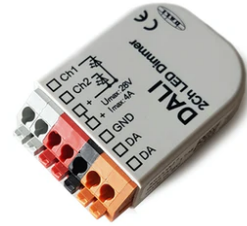
DALI PWM control interface 24Vdc 90W IP20. Power supply not included F990B09A000