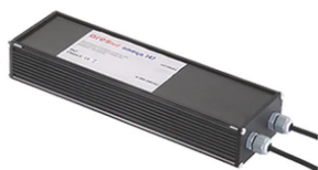
Power supply 24Vdc 50W / 120-240V IP67 Class II selv. Non Dimmable RF25755