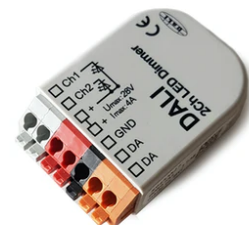
DALI PWM control interface 24Vdc 90W IP20. Power supply not included F990B09A000