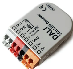
DALI PWM control interface 24Vdc 90W IP20. Power supply not included F990B09A000