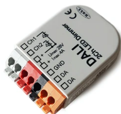
DALI PWM control interface 24Vdc 90W IP20. Power supply not included F990B09A000