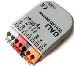
DALI PWM control interface 24Vdc 90W IP20. Power supply not included F990B09A000