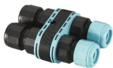
3/4 way terminal block 4 poles IP68 H2O stop. ( \varnothing 5,5 \div 12 mm cable) F990C010000