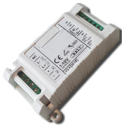
DALI PWM control interface 24Vdc 120W IP20. Power supply not included F990B07A000