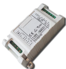
1-10V PWM control interface 24Vdc 120W IP20. Power supply not included F990B14A000